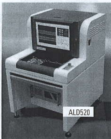
Automatický optický tester Aleader ALD 520